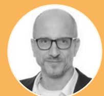
Andreas Clouth Grant Thornton